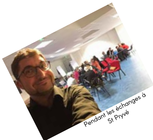
Pendant les échanges à St Prvé

Un très grand merci à lui pour sa disponibilité, sa bonne humeur et sa joie de vivre qui ont fait de ces 3 jours des moments hors du temps.