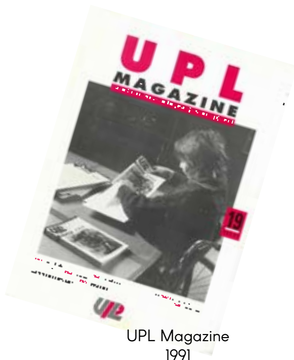
UPL Magazine 1991