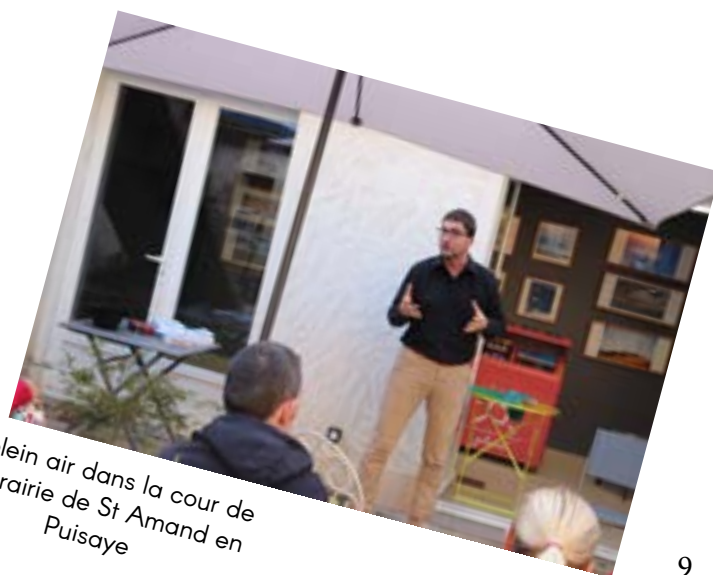
En plein air dans la cour de la librairie de St Amand en Puisaye