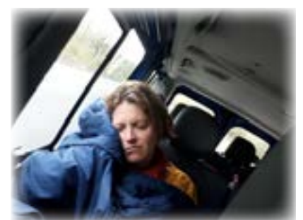
Même la maîtresse...