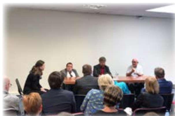
La table ronde