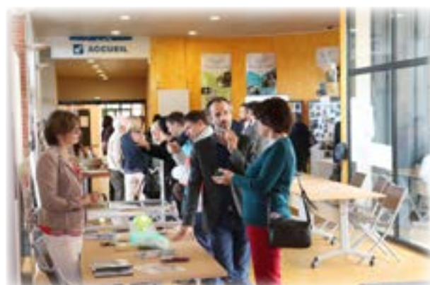
Les stands des structures

Les échanges avec le public ont été nombreux et riches.